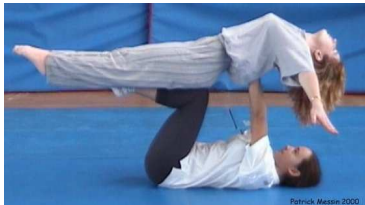
Porteur allongé dos au sol