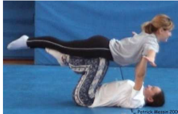
Porteur allongé dos au sol