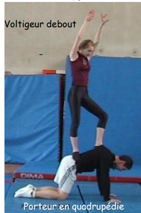
Porteur en quadrupédie