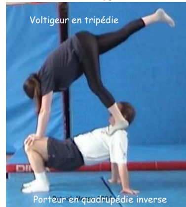
Porteur en quadrupédie inverse