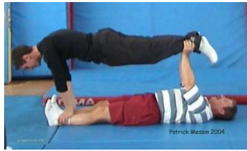
Porteur allongé dos au sol