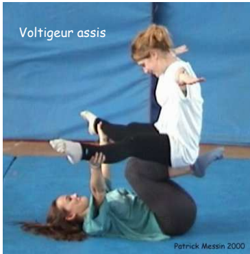
Porteur allongé dos au sol