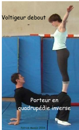
Porteur en quadrupédie inverse