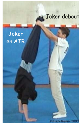
Joker en ATR