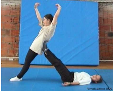
Porteur allongé dos au sol